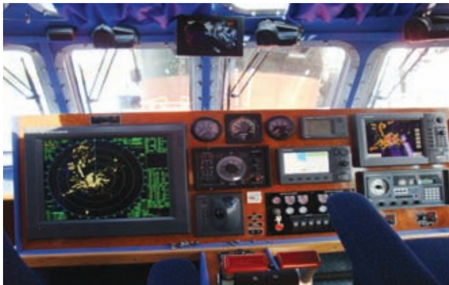
▲ La nueva "Salvamar" lleva los más modernos equipos de navegación.