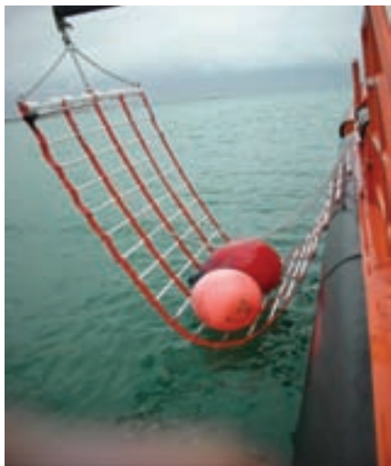
▲ En ambos costados lleva incorporadas "zonas de recogida" que facilitan el rescate de náufragos.

Puente de gobierno. Dispone de un amplio puente de gobierno donde dispone de los equipos más modernos en navegación y comunicaciones. Desde él se maneja la propulsión, gobier-