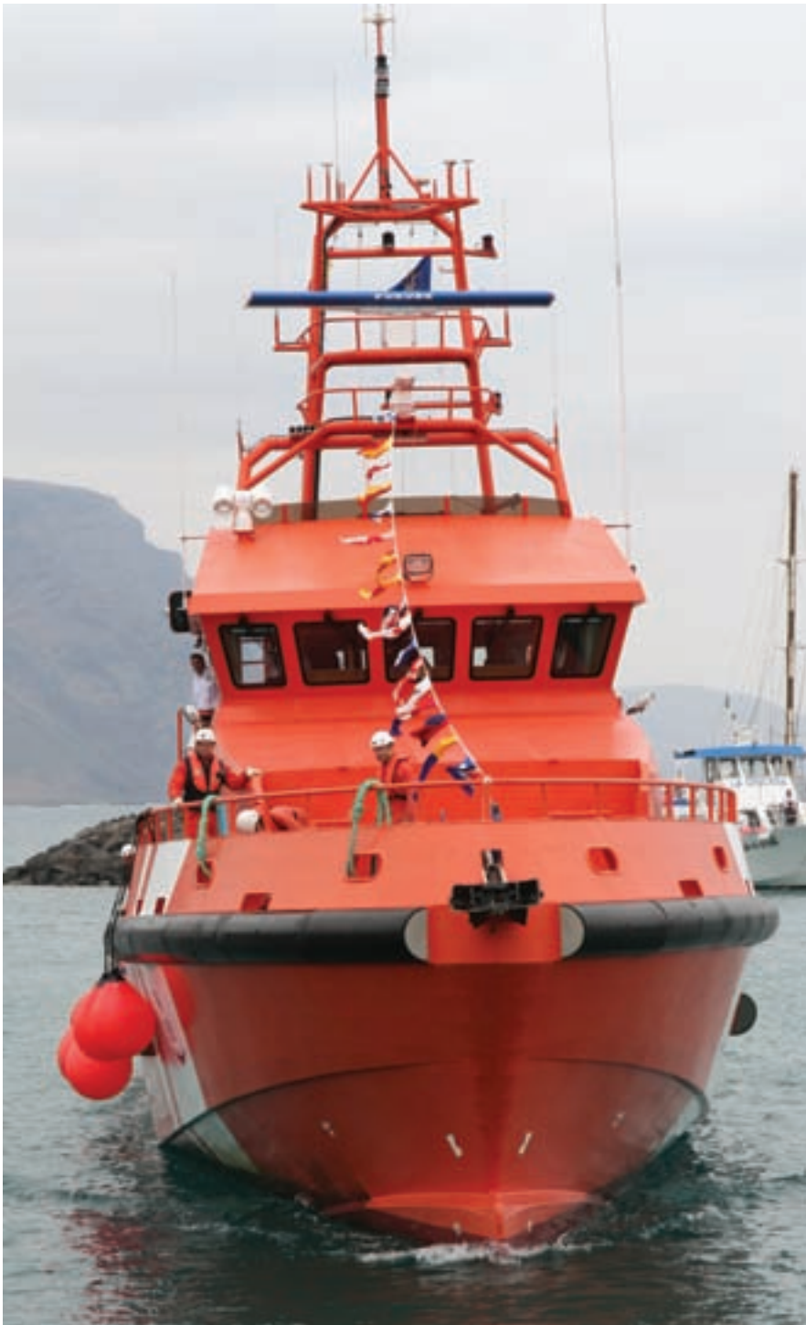
▲ La “Guardamar Talía” actúa a lo largo del Archipiélago y es la tercera de este tipo que ha entrado en servicio en la flota de Salvamento Marítimo en toda España.

no y control de los equipos de cámara de máquinas.