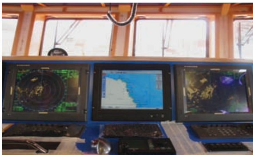
▲ Vista parcial de los equipos de navegación y comunicaciones.

Las “Guardamares” son un segundo tipo de embarcaciones de intervención rápida. Al igual que las “Salvamares”, poseen una gran maniobrabilidad. La “Guardamar Talía” está propulsada por dos motores diesel MTU 12V4000 M 70 de 1.740 a 2.000 r.p.m. cada uno. Estos motores transmiten su potencia a una reductora-inversora ZF-7550V que a su vez mueven a dos ejes que mediante dos hélices de paso fijo le da una gran maniobrabilidad llegando a lograr una velocidad máxima de 30 nudos. Para ayudar a las maniobras de atraque lleva una hélice transversal a proa con una potencia de 80 C.V.