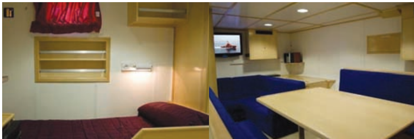
▲ La embarcación dispone de cuatro camarotes individuales y comedor.