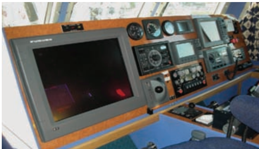
▲ En el frontal del puente están ubicadas las consolas donde van instalados todos los equipos de navegación, comunicaciones y control de cámara de máquinas.

sistencia de fricción y estática frente a las incrustaciones, resistencia a la abrasión y una capacidad para el ahorro de combustible.