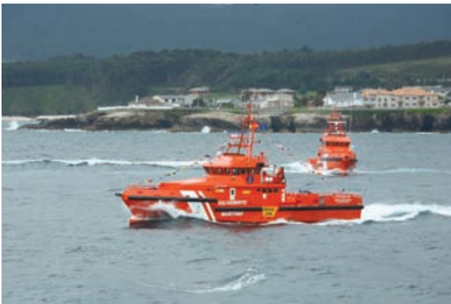
▲ La nueva unidad está habilitada para la recogida de las personas desde la mar y la atención de naufragos.

ta de clasificación: I_HULL_MACH - LIGHT SHIP - SPECIAL SERVICE. FAST RESCUE BOAT - UNRESTRICTED - AUT - UMS.