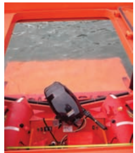
▲ Estiba de la RIB en la "Guardamar".

Incorpora una maquinilla hidráulica a popa Ibercisa MR-H/25/300-30 con capacidad para una estacha de 500 metros y 24 milímetros de alta resistencia para labores de remolque lo que le permite alcanzar un de tiro de 20 toneladas a punto fijo. Dispone para movimientos de pesos de una grúa de cubierta Guerra M.60.90.A2. Esta grúa tiene un alcance 7 metros.