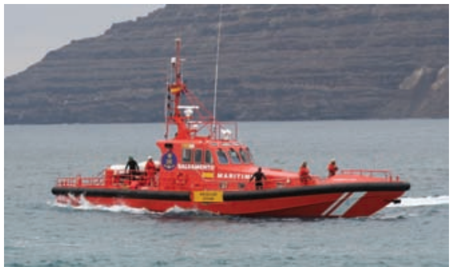
▲ La “Salvamar Al Nair” lleva incorporados los más modernos sistemas en salvamento y rescate.

Equipos auxiliares. Incorpora un motor auxiliar de la marca Onam con una potencia de 11 kW a 220 v y 50 Hz. Este grupo generador da servicio a todos los sistemas eléctricos de barco. A la obra viva se le ha dotado de un revestimiento a base de tecnología fluoroporimera Intersleek 900 que combate las incrustaciones y que reúne los últimos avances en la tecnología del fouling , como tener una menor re-