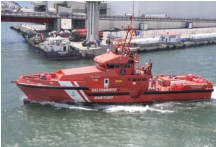
▲ Las características de esta embarcación la hacen muy práctica para misiones de búsqueda y salvamento.