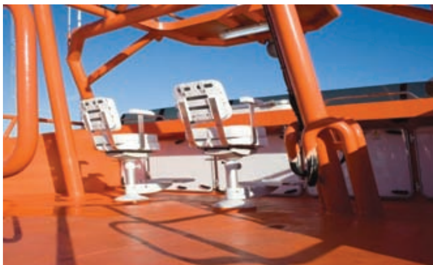
▲ Disposición del puente alto.

Las “Guardamares” son un segundo tipo de embarcaciones de intervención rápida. Al igual que las “Salvamares”, poseen una gran maniobrabilidad. La “Guardamar Talía” está propulsada por dos motores diesel MTU 12V4000 M 70 de 1.740 a 2.000 r.p.m. cada uno. Estos motores transmiten su potencia a una reductora-inversora ZF-7550V que a su vez mueven a dos ejes que mediante dos hélices de paso fijo le da una gran maniobrabilidad llegando a lograr una velocidad máxima de 30 nudos. Para ayudar a las maniobras de atraque lleva una hélice transversal a proa con una potencia de 80 C.V.